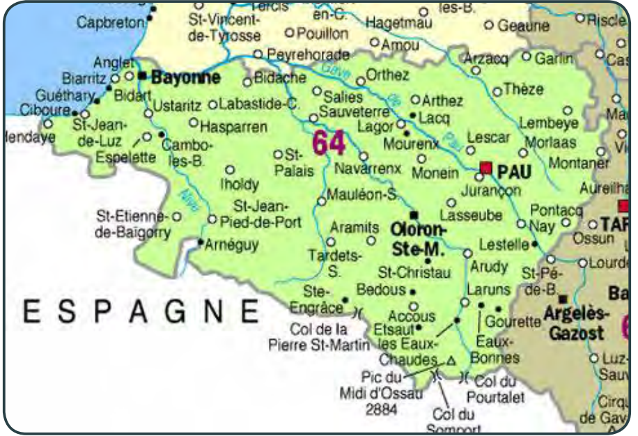
* İparralde'nin belkemiği Pyrénées Atlantiques departmanı haritası